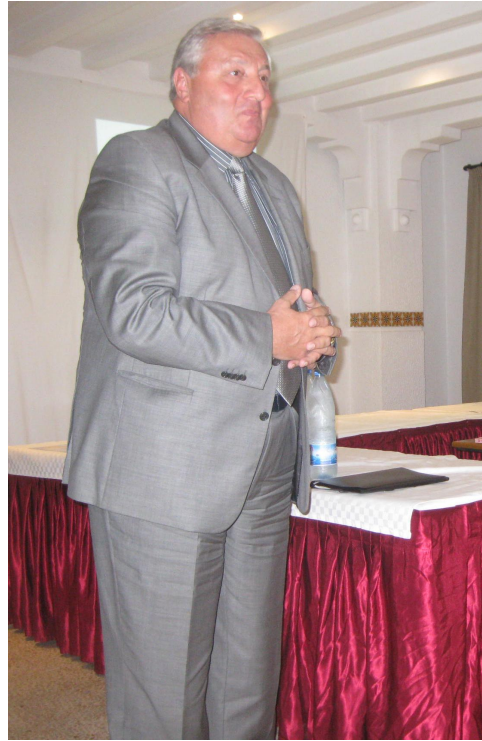
.7. ( )

9). 1- 52, 3- 90. 4- 10 2010 110 2- ( .8 - ) ( .4 - 7).