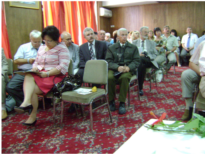
.3. ( )