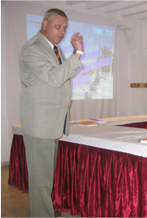
.6. ( )