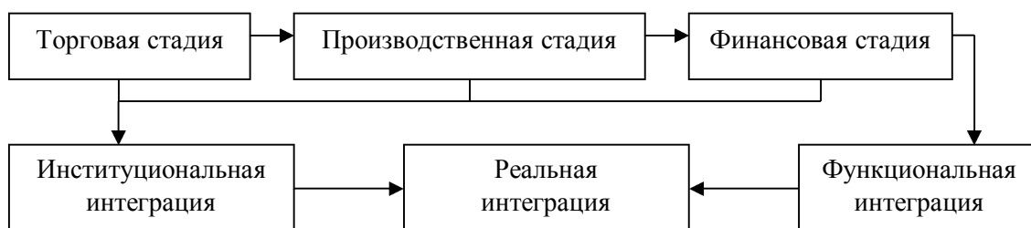
Рис. 2. Порядок стадий эволюции интеграционного процесса

Эволюционному подходу к процессу региональной интеграции присущи стадии развития объекта, которые характеризуются социальными, политическими и экономическими чертами и структурообразующими моментами. Порядок стадий эволюции интеграционного процесса представим на Рис. 2.