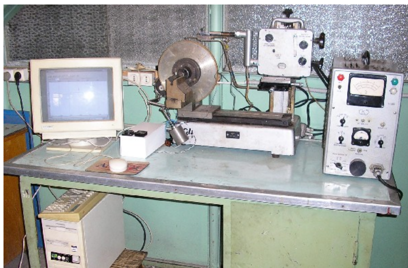
Рис. 1. Общий вид комплекса для регистрации рельефа режущей поверхности алмазных кругов на металлической связке

Для исследования РПК предложен измерительный комплекс [5], включающий устройство для закрепления шлифовального круга с узлом его вращения, комплект приборов профилометра-профилографа «Калибр» модели 201 (устройство для профилографирования и блок усиления), компьютер, снабженный преобразователем аналогового сигнала в дискретный, и дисплей (рис. 1).