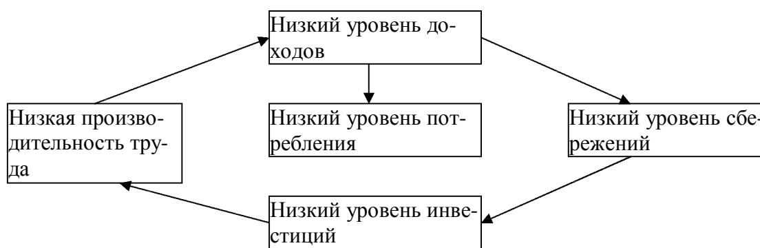
Рис.1. Порочный круг бедности.

Под новым более высоким качеством жизни обычно понимается достойный уровень потребления, высокий уровень сбережений, возможность получения необходимой профессиональной подготовки на основе адекватного вознаграждения за труд. При этом необходимо учитывать феномен пребывания мигрантов в состоянии некой экономической иллюзии о том, что новые условия проживания обеспечат более высокое качество жизни. Нередко формируется такая ситуация, при которой, однажды попав в так называемый порочный круг бедности, человек не может из него выбраться, даже сменив страну пребывания. Обладая только сиюминутной мотивацией, работник способен исполнять только приказы и распоряжения, получая при этом в лучшем случае среднюю зарплату для периферийных стран. Изменяются только относительные показатели по сравнению с родиной эмигранта, а реально круг взаимосвязей не меняется (рис 1).