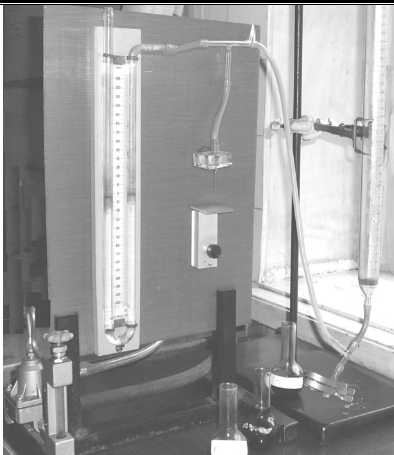
Рис. 1 – Экспериментальная установка

духа. Были подготовлены водные растворы исследуемых реагентов - вспенивателей с концентрацией C = 1-3 мл/л. Для определения высоты пенного слоя H проводилось несколько измерений и по средним значениям построены графики зависимости высоты от концентрации раствора (рис. 2).