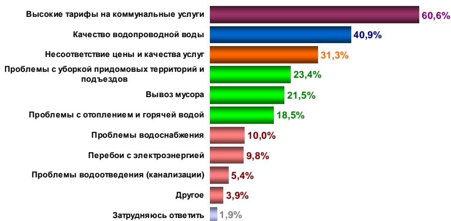
Рис. 1 – Результаты социологического опроса о проблемах ЖКХ.

Акцент, в данном определении, делается на важнейшее функциональное свойство товара: способность удовлетворять потребности потребителя. В реальности же, согласно данным ряда социологических опросов, проведенных Центром социальных технологий «Социополис» [12], которые озвучил Н.Я.Азаров: "...70% населения не удовлетворено качеством предоставляемых жилищно-коммунальных услуг". Это свидетельствует о том, что ЖКУ, как товар, не в полной мере удовлетворяют потребности населения. Ситуация более чем критическая: ЖКХ превратилось в отрасль производящую дефектные товары. Сложно представить подобное в иной сфере, где бы уровень брака составлял 70%, и при этом потребитель приобретал и оплачивал такой товар. Кроме того, снижающееся качество услуг сопровождается планомерным ростом тарифов, что еще более повышает уровень неудовлетворенности потребителей работой жилищно-коммунальных служб (рис. 1) [12].