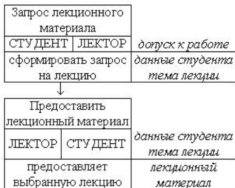
Рисунок 2 – Протокол запроса лекции на её изучение

Поскольку учебный процесс основан на общении преподавателя со студентами, то работа МАС обучения построена на общении агентов [6]. Для каждого вида общения, определенного названием протокола в модели ролей, составлен протокол взаимодействия. Совокупность всех протоколов взаимодействия ролей составляет модель взаимодействий. На рис.2 представлен пример протокола взаимодействия между ролями СТУДЕНТ и ЛЕКТОР при запросе лекции. В начале агент Студент формирует запрос на лекцию и отправляет сообщение Лектору со своими данными и темой запрашиваемой лекции. Лектор принимает сообщение Студента и возвращает ему лекционный материал.