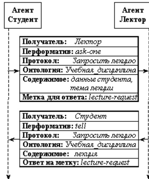
Рисунок 3 – Формат сообщений при коммуникации агентов

Таким образом, чтобы общаться друг с другом, агенты должны уметь формировать запросы и ответы в формате сообщений языка KQML. В соответствии с моделью взаимодействия, для каждого протокола взаимодействия ролей разработаны сообщения в