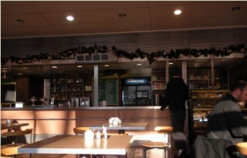
Столовая Варшавского университета