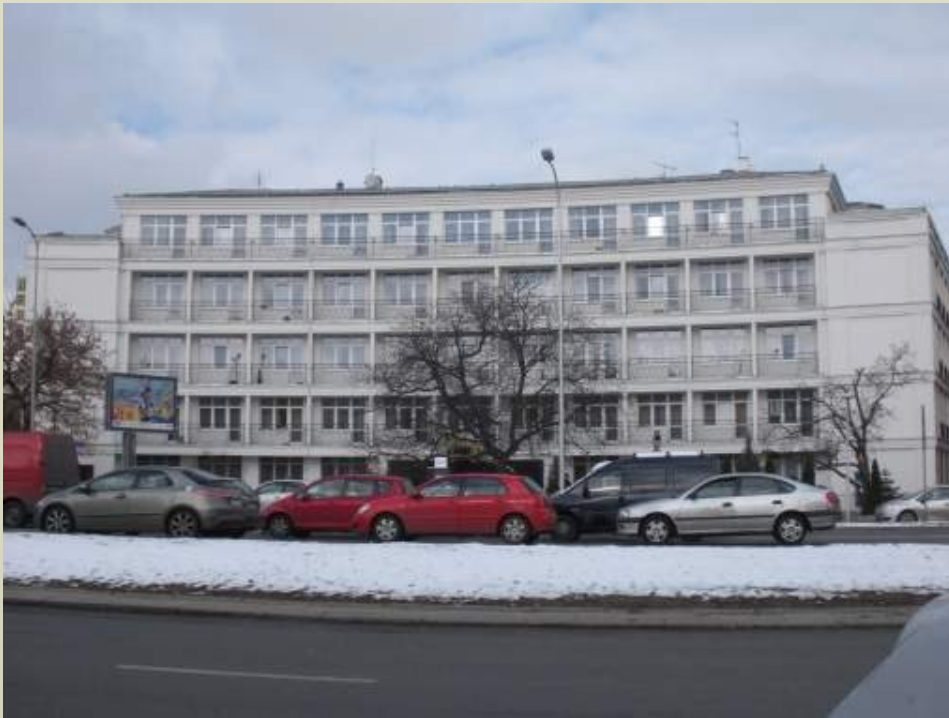
Общежитие факультета биологии Варшавского университета