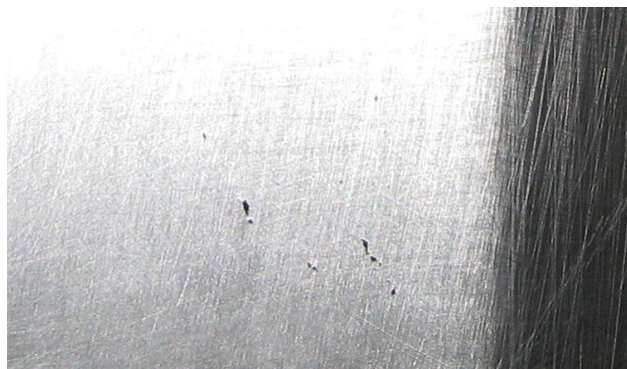
Рисунок 1 – Раковины на беговой дорожке наружного кольца двухрядного роликового подшипника