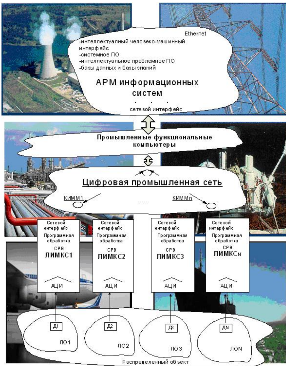
Рис. 1. Обобщенная архитектура технической (технологической) распределенной интеллектуальной микрокомпьютерной системы мониторинга

На верхнем уровне РИМКС мониторинга располагаются АРМ операторов, которые строятся на основе персональных компьютеров (ПК) общего и промышленного назначения. На АРМ операторов реа-