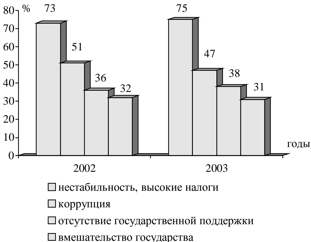
Рис. 1 -Причины, которые мешают развитию предпринимательства в Украине

По состоянию на 01.01.2003 количество зарегистрированных предприятий сферы малого бизнеса в Донецкой области выросло по сравнению с 2001 годом на 521 предприятие или на 2,1 % и составило 25354 (рис. 2) [3].