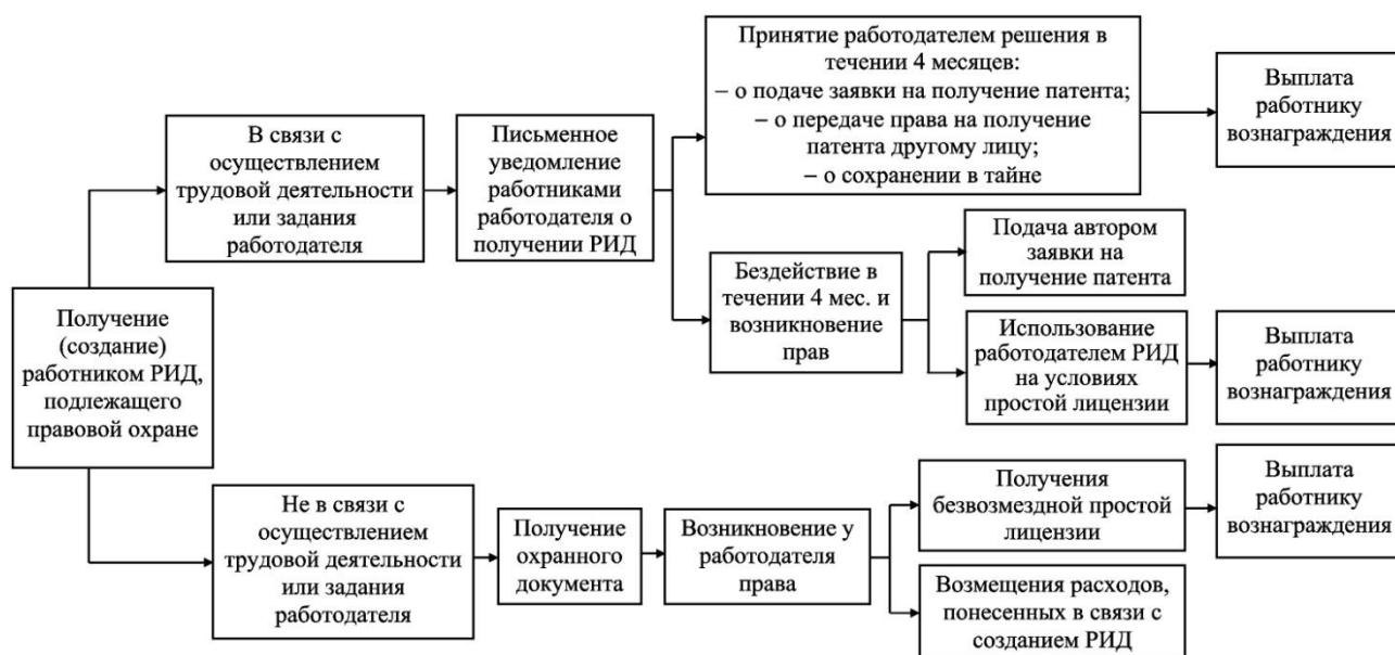
Рисунок 2 – Основные этапы получения работником РИД

При получении исполнителем в ходе выполнения работ по договору РИД, прямо не предусмотренного в нем, право на государственную регистрацию возникает у исполнителя, если не определено иное. В данном случае у заказчика появляется право использовать РИД в целях, в соответствии с которыми был заключен договор на условиях безвозмездной простой (неисключительной) лицензии без выплаты дополнительного вознаграждения.