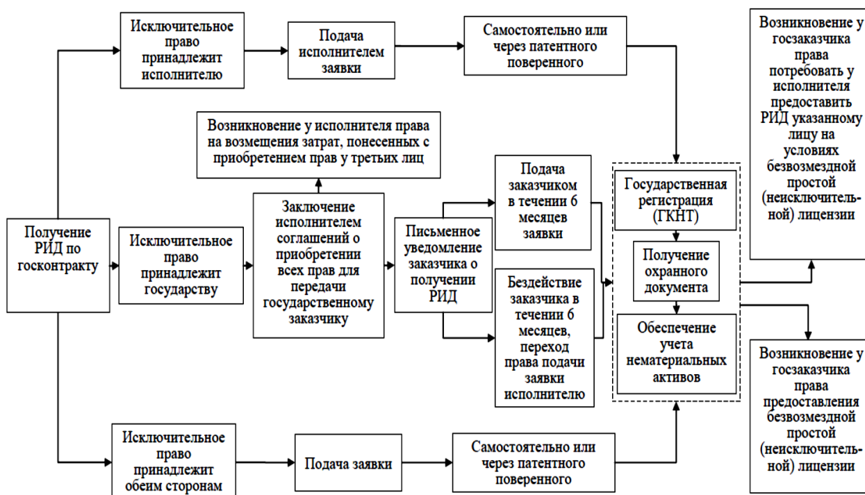
Рисунок 4 – Основные этапы возникновения исключительных прав на РИД, созданные при выполнении работ по государственному (муниципальному) контракту

В ГК ДНР предусмотрена норма, в соответствии с которой государственный заказчик в течение полугода с момента получения от исполнителя письменного уведомления обязан осуществить государственную регистрацию РИД в уполномоченном органе (ст. 1468 п. 2), при его бездействии это право возникает у исполнителя. В случае, когда в государственном контракте предусмотрена возможность совместного владения ИП на РИД, между заказчиком и исполнителем должно быть заключено соглашение, где определяются права и обязанности сторон при распоряжении ИП. Основные этапы возникновения ИП на РИД, созданные при выполнении работ по государственному (муниципальному) контракту представлены на рисунке 4.