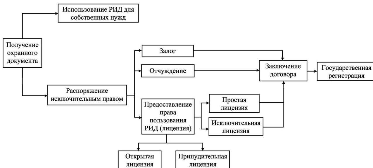
Рисунок 5 – Формы распоряжения исключительными правами на РИД

5. Распоряжение ИП может осуществляться правообладателем любым не противоречащим законодательству способом. ИП признается и охраняется государством при условии государственной регистрации такого результата и получении охранного документа. К основным формам распоряжения ИП можно отнести предоставление права использования (лицензии), отчуждение, залог. Распоряжение ИП в указанных формах осуществляется на основании договора, который подлежит обязательной государственной регистрации. В случаях, когда распоряжение ИП осуществлялось без государственной регистрации, переход таких прав считается несостоявшимся. Необходимо отметить, что РИД, прошедший государственную регистрацию, схема распоряжения которым представлена на рисунке 5, подлежит бухгалтерскому учету как нематериальный актив.