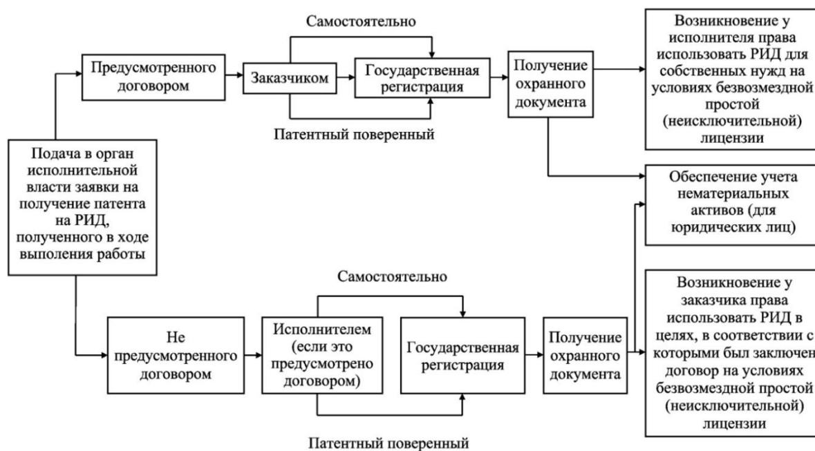
Рисунок 3 – Основные этапы возникновения ИП на РИД, созданные при выполнении работ по договору

В ГК ДНР предусмотрена норма, в соответствии с которой государственный заказчик в течение полугода с момента получения от исполнителя письменного уведомления обязан осуществить государственную регистрацию РИД в уполномоченном органе (ст. 1468 п. 2), при его бездействии это право возникает у исполнителя. В случае, когда в государственном контракте предусмотрена возможность совместного владения ИП на РИД, между заказчиком и исполнителем должно быть заключено соглашение, где определяются права и обязанности сторон при распоряжении ИП. Основные этапы возникновения ИП на РИД, созданные при выполнении работ по государственному (муниципальному) контракту представлены на рисунке 4.