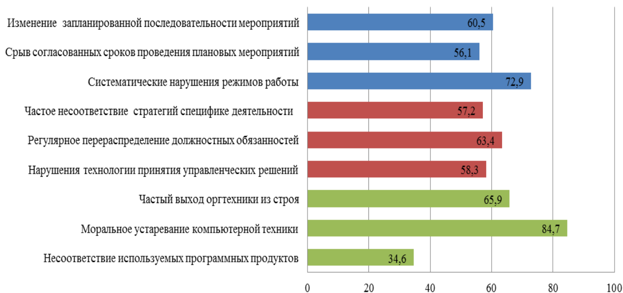
Рисунок 2 – Распределение ответов респондентов на вопрос об основных технических, технологических и организационных проблемах стратегического планирования, %

Согласно данным, представленным на рисунке 2, среди трех основных организационных проблем выделяется одна, связанная с систематическими нарушениями режима работы предприятия, негативное влияние которой на процесс стратегического планирования отметили 72,9 % респондентов. В свою очередь, срыв согласованных сроков проведения плановых мероприятий и изменение их последовательности в качестве проблемы указали 60,5 % и 56,1 % опрошенных, соответственно.