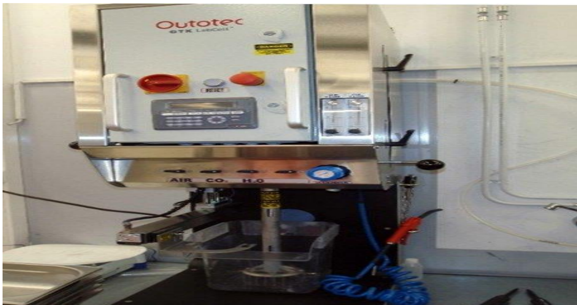
Рис. 1. Лабораторная флотомашина Outotec GTK LabCell™

рассчитывается на основе частиц и их минерального состава. Параметры кинетической модели флотации рассчитываются по данным непрерывного пробоотбора на предприятии или испытаний на лабораторных установках. На рис. 1 показана лабораторная флотомашина периодического действия Outotec GTK LabCell [2].