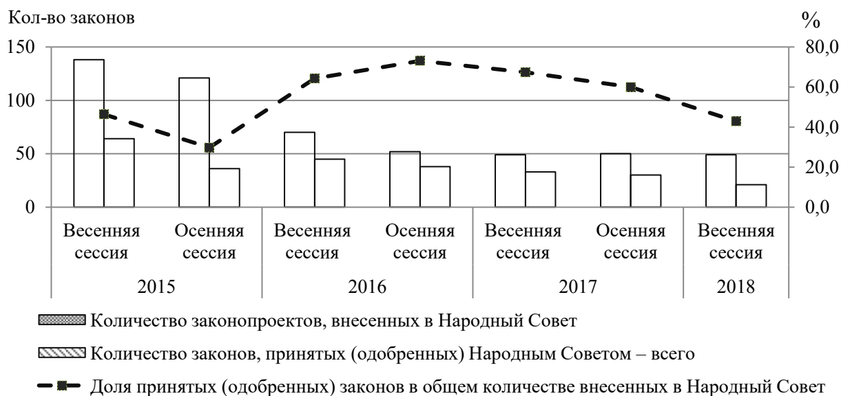
Рис. 1. Законотворческая деятельность Народного Совета ДНР, 2015-2018гг. 1

Однако в среднем за представленный период было издано всего лишь 54,8% законов от общего количества поданных законопроектов в Народный Совет: в 2015г. доля принятых законов составляла 38,6% от общего количества поданных проектов нормативных правовых актов высшей юридической силы, в 2016г. – 68,0%, в 2017г. – 63,6% (рис. 1).