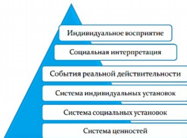
Рис. 1. Фильтры индивидуального восприятия бытия.

Как показано на схеме ниже (рис.1), восприятие бытия каждым человеком, живущим в цивилизованном обществе, обусловлено компонентами его социально-когнитивных установок и паттернов восприятия, основу которых составляет национальная система ценностей , характерная для определенной социально-экономической, культурно-политической и духовной общности, т.е. нации, а также система социальных установок , внедряемая в сознание и бессознательное индивидов государственными средствами массовой информации под руководством национального правительства.