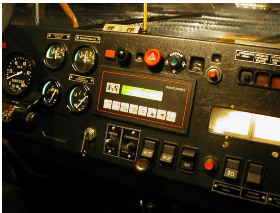
Рис. 2. - Размещение индикаторной панели контроллера СКЗ 02.01 в кабине автосамосвала БелАЗ

Сбор информации осуществляется при помощи технологии GPS (Global Positioning System), которая с достаточной точностью в реальном масштабе времени позволяет определять положение и скорость каждого транспортного средства, находящегося в зоне работы системы и оснащенного специализированным бортовым комплектом оборудования (рис.2).