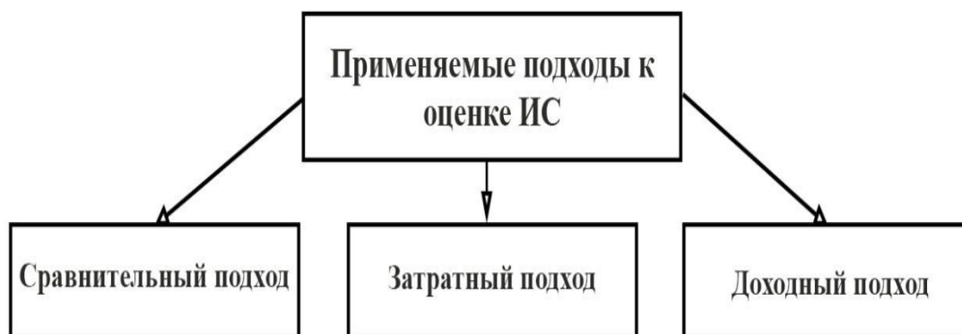
Рис. 2. Применяемые методические подходы к оценке интеллектуальной собственности на предприятиях

Среди современных подходов к оценке объектов интеллектуальной собственности наиболее распространёнными являются (рис. 2).