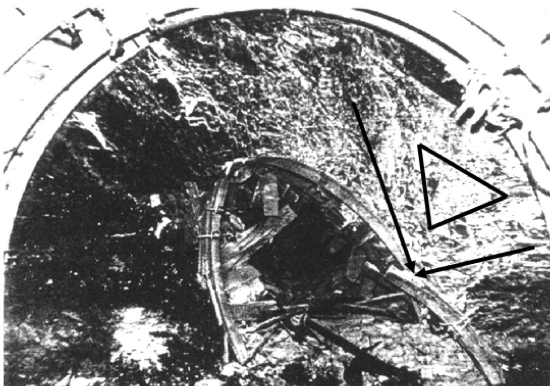
Рис. 2 – Потеря выработкой устойчивости по второй схеме

При потере устойчивости по второй схеме (жесткая) (рис. 2) происходит формирование «клина вдавливания» с углом раскрытия близким к прямому, при этом, внутри клина образуется ядро перемятых уплотненных пород с полной потерей структуры, а со стороны противоположной основному направлению деформирования, появляется дополнительное вдавливание, соответствующее предыдущей стадии деформирования. В этом случае для сохранения устойчивости выработки, простого механического воздействия недостаточно.