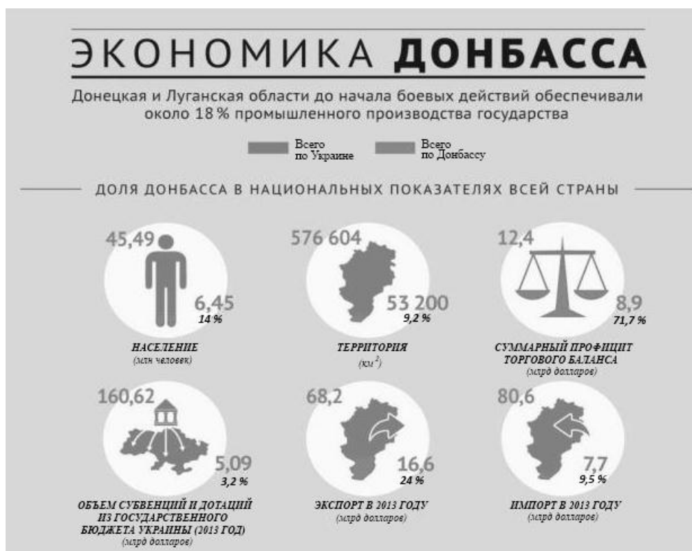
Рисунок 1 – Экономика Донбасса в 2013 г.

Кроме того, железнодорожное сообщение Украины на треть от общего объема перевозок обеспечивала Донецкая железная дорога – 12 % приходилось на пассажирские перевозки. В области действовало два международных аэропорта (в Мариуполе и Донецке) [9]. Если рассматривать показатели экономики Донбасса в 2013 г. (Донецкой и Луганской областей), то ее общий удельный вес и значимость в национальной экономике еще более существенны (рисунок 1) [10].