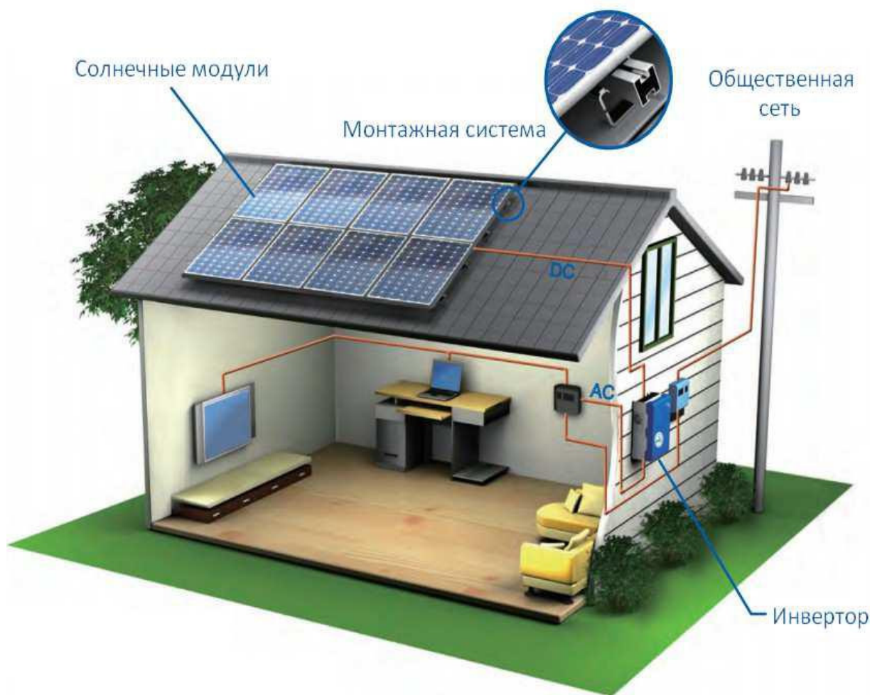
Рисунок 3 – Строение сетевой солнечной электростанции