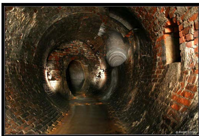
Рис.1 - Подземная река Бахмутка

В Донецке существует множество мифов и легенд о советских сокровищах в бомбоубежищах, линии узкоколейного метро, для эвакуации первых руководителей и таинственной подземной реке возле ДМЗ. Возможно, именно поэтому в Донецке несколько лет назад появились первые диггеры - исследователи подземелий. Сейчас их чуть больше десяти в Донецке и Макеевке, они не являются профессиональными спелеологами, но в часы досуга с удовольствием изучают теплотрассы, заброшенные шахты и предприятия.