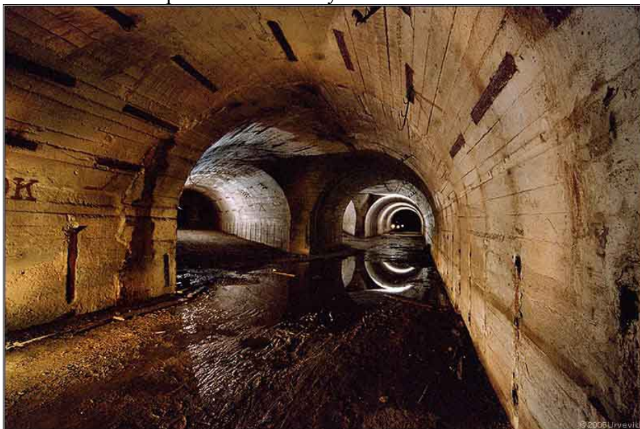
Рис.4 – Подземный туннель под Кальмиусом

В любой момент по рельсам можно пустить шахтные вагонетки. Не более того.