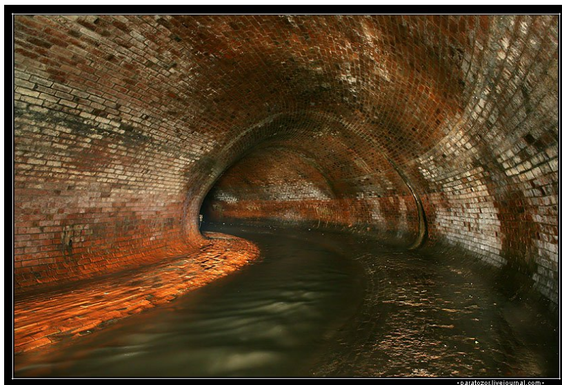
Рис.2 - Секретное метро

Ходят ещё легенды о подземном военного госпиталя на две тысячи коек. Но где он мог находиться, никто не знает - возможно, под областной травматологией, а ещё - под больницей Калинина.