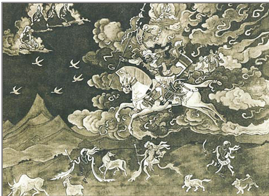
Шамбала идет. Н.К.Рерих, 1925 г.

Цивилизация нашей планеты хотя и отстала в своём развитии от населения других планет нашей солнечной системы, но оно имеет свои преимущества, которых нет на других планетах. Благодаря чрезмерному интересу к материальному плану существования, люди Земли развили в себе особенное рациональное мышление математического характера, которого цивилизации других планет не достигли из-за их склонности к созерцательно-духовному образу мышления, которое на Земле близко образно-гуманитарному складу ума. В этом преимуществе землян кроется и основная трудность для дальнейшей эволюции, т.к. сознание людей очень трудно и неохотно воспринимает духовные истины, направляя свои растущие силы на развитие голого разума, не подкреплённого сердечными чувствами. В этой связи усиливается опасность скатывания земной цивилизации в технократический тупик развития, в конце которого человечество ждёт саморазрушение. Единственным выходом из этого тупика является строительство мировой общины. Человечество должно выбирать между технократическим самоистреблением или вечной жизнью через приобщение к вселенской общине. Будем надеяться, что чувства взаимной любви и уважения друг к другу возобладают в сердцах людей, и они обратятся к мирному строительству нового справедливого общества во имя всеобщего блага всех жителей Земли и всей нашей бесконечной вселенной.