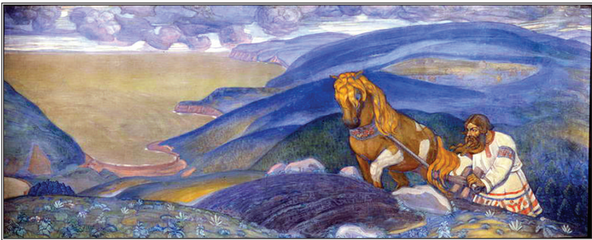
Микула Селянинович. Н.К.Рерих, 1910 г.

«Будда заповедал Мировую Общину как эволюцию человечества»