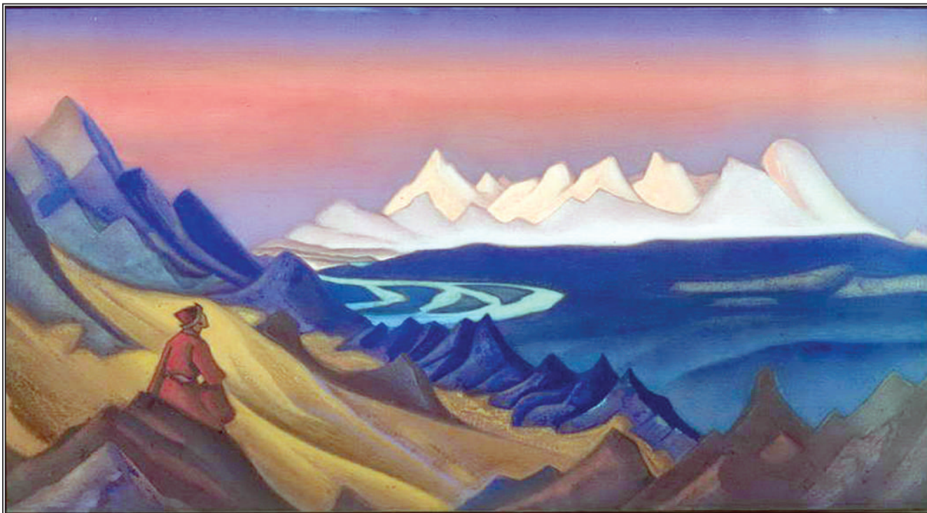
Шамбала идет. Н.К.Перих, 1926 г.

Оплот Тех Немногих, что Держат и Ведут Землю, и тех, кто сослужит Им в обоих мирах. Упование всех концов Земли.