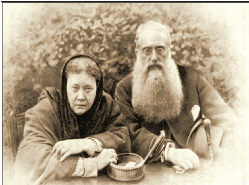
Е.П. Блаватская и Г.С. Олкотт

склонности к пассивности. Через веру (т.е. знание, которое приходит путем приложения в жизни бескорыстия и милосердия) очищается сердце от страстей и глупости; от этого происходит овладение телом и, после всего этого, подчинение чувств.