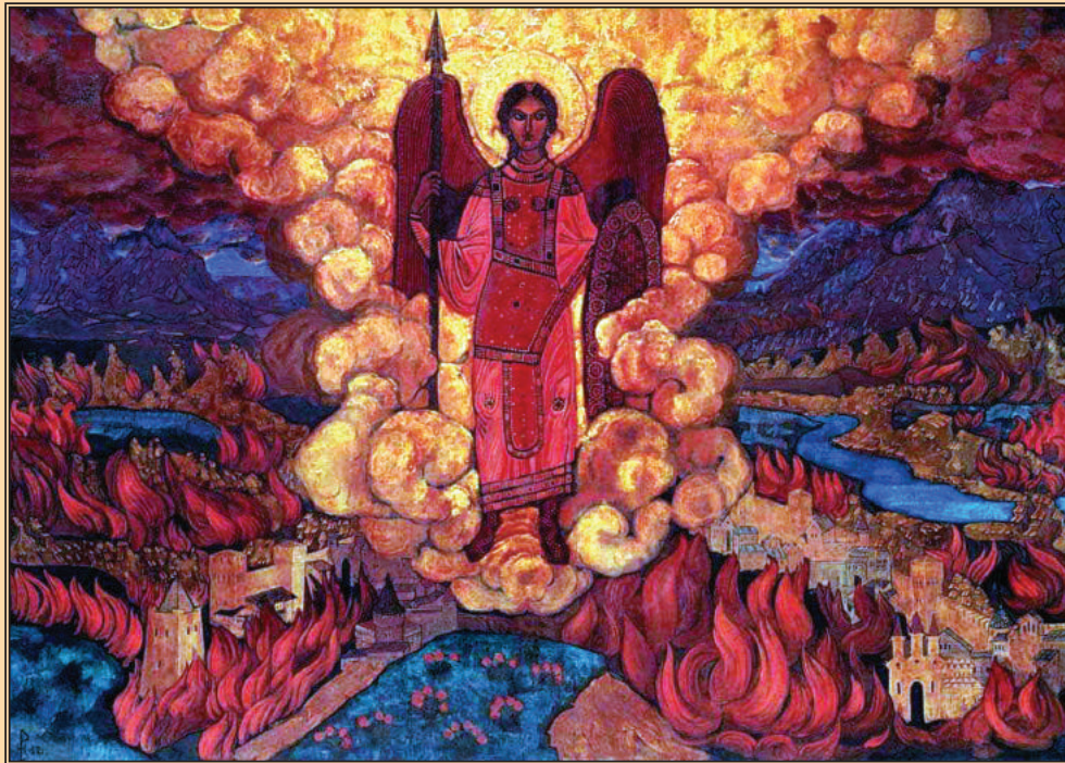
Н.К. Рерих "Ангел последний" 1912.

Сейчас пишется картина, напоминающая об "Ангеле Последнем" 1912 года, только тогда название было - "И пролетит над Землею", а теперь будет - "И пролетел над землею Грозный, Прегрозный". Вехи в разные времена данные, уже становятся на свои места. Н.К. Рерих. Письма в Америку. 30.X.41.