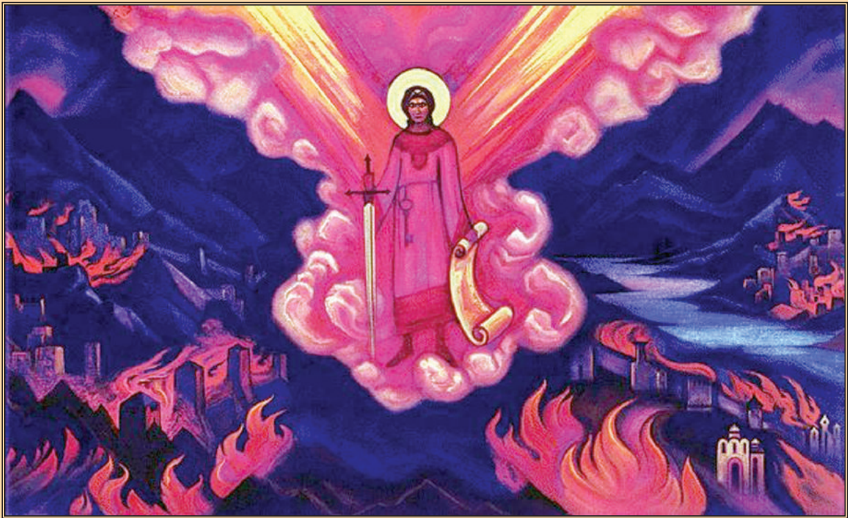
Ангел Последний (Грозный) Н.К.Рерих 1942 г.

Отражаю врагов. Явление врагов повсеместно. Чую, как пытаются завладеть Нашими достижениями. Считайте, что победа опять будет за Нами, хотя бы пот крови выступил на Моем лице. Дружными планами построения поддерживаете Мою битву. Можно всеми силами удержаться от раздирания. (9.12.1927)