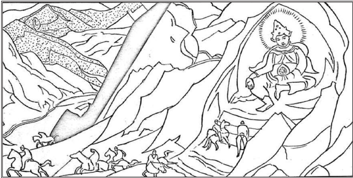
Тангла. Песнь о Шамбале. Н.К.Рерих, 1943 г.

воспользовалось древними торговыми дорогами, - спустилось по Днепру в Черное море и оттуда в Византию (великий водный путь из Варяг в Греки), из Византии отправилось дальше, к побережью Каспийского (Хвалынского) моря, переплыло его и попало в земли неведомые и неизвестные. Отсюда началось особенно трудное и опасное путешествие. Верблюды не были в диковинку на Руси, которая постоянно приходила в соприкосновение с различными степняками, пользовавшимися этими животными в качестве средства передвижения.