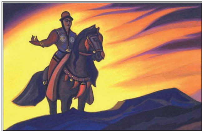
Настасья Микулична. Н.К.Рерих, 1938 г.

но только в общине, то они овладеют скрытыми силами природы, которые дадут человечеству возможность общаться с другими инопланетными цивилизациями, находящимися на тонкоматериальном уровне. Для правильного изучения всеначальной космической энергии необходимо принять учение Живой Этики, в котором описаны все направления развития человечества, необходимые для восхождения на новый космический уровень сознания. Строя на планете Земля мировую общину согласно учению Живой Этики на незыблемых основах космических законов, человечество согласует свою цивилизацию с законами и порядками инопланетных цивилизаций, где уже восторжествовал общиннический строй. Восходя на уровень развития этих цивилизаций, человечество Земли создаёт предпосылки для общения и всеобъемлющего сотрудничества с этими инопланетными расами. К ним в нашей солнечной системе относятся цивилизации планет Венера и Юпи-