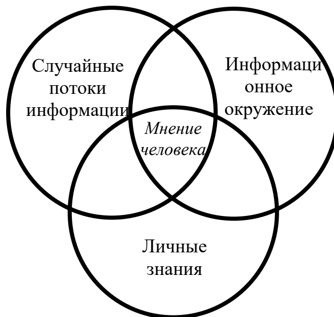
Рисунок 1 – Модель формирования мнения человека

Каждый человек находится в определенном информационном пространстве. Оно оказывает значительное влияние на человека, но и сам человек влияет на него, это есть один из примеров информационного воздействия. В процессе этого взаимодействия формируется «мнение человека». Упрощенная модель формирования мнения человека показана на рисунке 1.