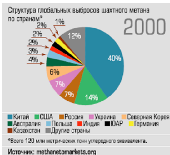
Рисунок 2 - структура глобальных выбросов шахтного метана по различным странам

Температура горных пород достигает 45°C. Но наибольшая сложность горно-геологических условий состоит в том, что преимущественная часть угольных пластов опасна при добыче угля. 90% действующих шахт характеризуются высоким риском добычи угля по причине повышенного содержания метана и внезапным выбросам метана. На рис.2 приведена структура глобальных выбросов шахтного метана по различным странам. Эффективным средством борьбы с метаном считается опережающая дегазация угольных пластов, что, также несомненно, повышает безопасность проведения горных работ.