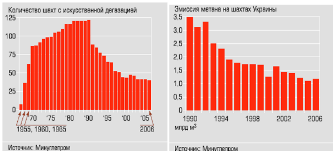
Рисунок 3 – Системы дегазации и их эффективность

На рис.3 приведена информация о наличии систем дегазации и их эффективности.