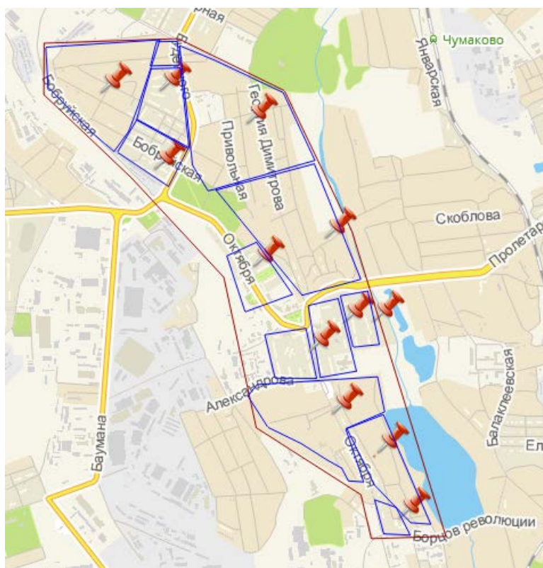
Рисунок 1- Разделение района на зоны обслуживания

Буденновский район находится на юго-востоке города Донецка и занимает территорию 25 км 2 с населением около 12350 человек. В настоящее время на рассматриваемом участке района (рис. 1) услуги доступа в Интернет предоставляют несколько провайдеров. Наиболее популярные из них: East.NET, MATRIX, ASDNet, Теленет. Однако, их телекоммуникационная инфраструктура создана достаточно давно, использует морально устаревшие технологии подключения абонентов, что не дает возможность предоставлять услуги с высоким качеством обслуживания. Также указанные провайдеры не всегда могут предоставить абонентам заявленную скорость передачи данных.