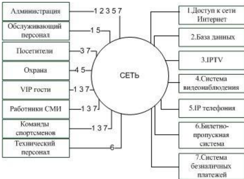
Рисунок 1 – Информационная модель сети

Количество пользователей определенной услуги будет неодинаковым в разных секторах. Также будет учитываться расположение ресторанов, магазинов и количество людей в зонах.