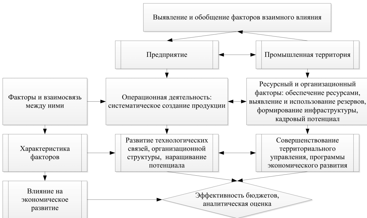
Рис. 1. Влияние и обобщение факторов взаимного влияния предприятия и промышленной территории