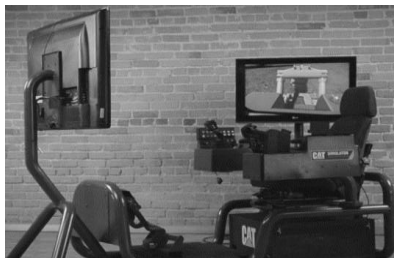
Рисунок -1. Hardware составляющая тренажёра

• Внедрение новых качественных методов подготовки персонала;