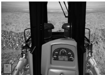
Рисунок-4. Симулятор от

условиями и сбор статистики во время и после процесса обучения.