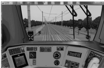
Рисунок -2. Симулятор Microsoft Train Simulator

На рынке современных тренажёрных систем присутствуют симуляторы компаний TRANSAS (морские суда), Caterpillar (тяжелая строительная техника, см Рис.4), Microsoft (авиационная и железнодорожная техника, см Рис.2). Программные продукты первых двух компаний являются полномасштабными симуляторами, с использованием специальных инженерных