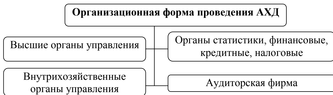
Рис. 3. Организационные формы проведения АХД

Организационные формы АХД определяются составом аппарата и техническим уровнем управления на предприятиях. Периодично анализ деятельности проводят высшие органы управления. Организационные формы АХД приведены на рис. 3.