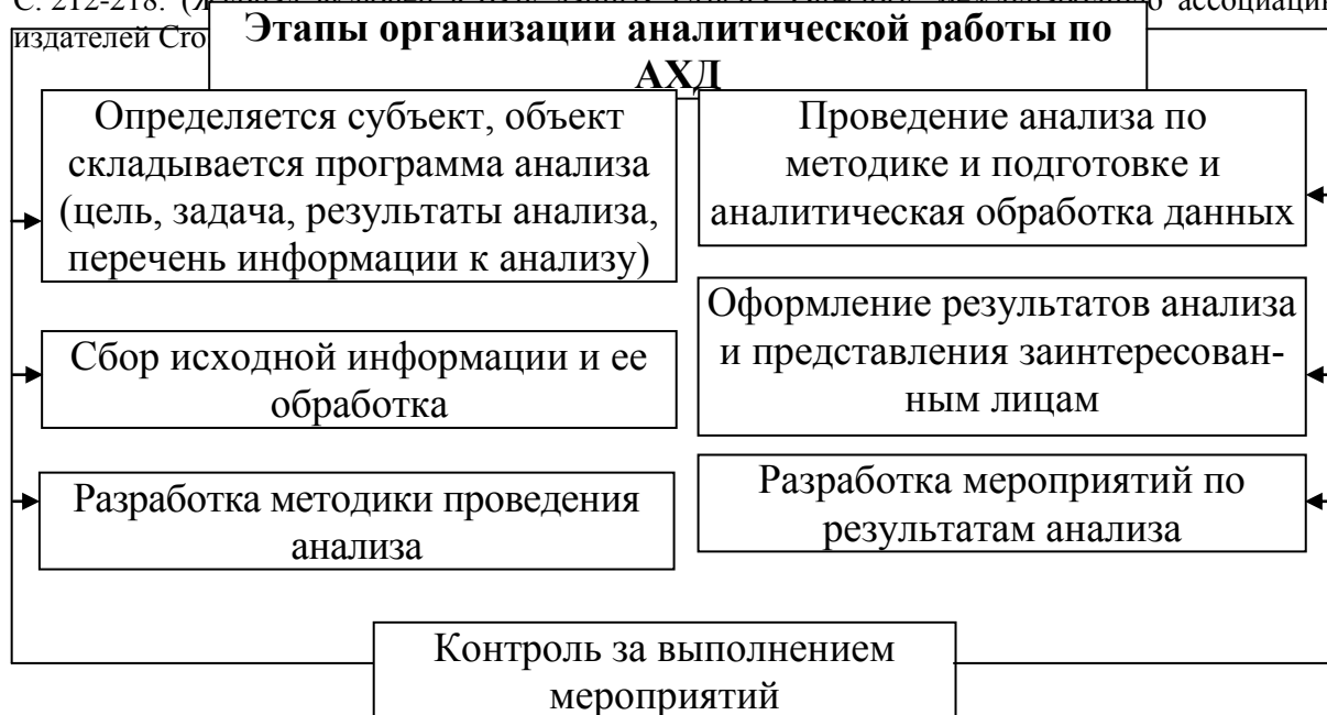
Рис. 2. Этапы организации аналитической работы за АХД

Организационные формы АХД определяются составом аппарата и техническим уровнем управления на предприятиях. Периодично анализ деятельности проводят высшие органы управления. Организационные формы АХД приведены на рис. 3.