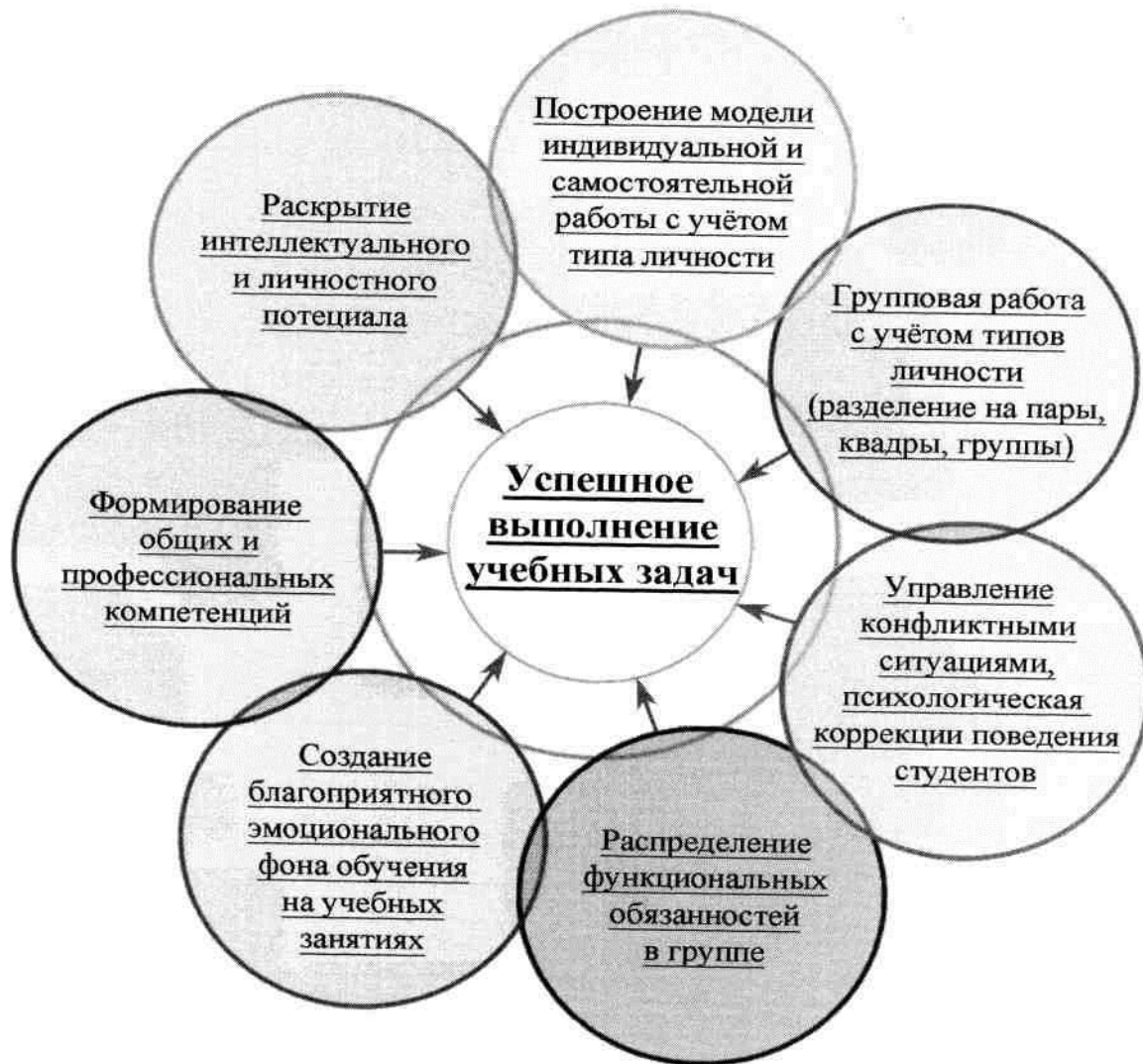
Рисунок 3 – Использование методов соционики в педагогической практике

Ряд исследователей отмечают эффективность внедрения методов соционики в образовательный процесс (рис. 3).