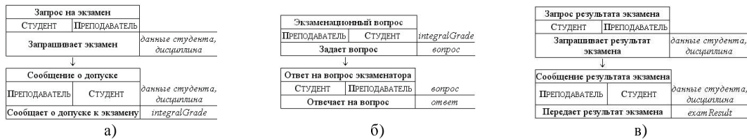
Рисунок 2 – Протоколы взаимодействия ролей СТУДЕНТ и ПРЕПОДАВАТЕЛЬ: а) ЗАПРОС НА ЭКЗАМЕН, б) ЭКЗАМЕНАЦИОННЫЙ ВОПРОС, в) ЗАПРОС РЕЗУЛЬТАТА ЭКЗАМЕНА.