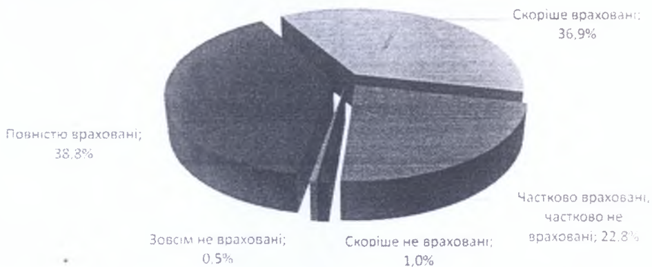
Рис. 1. Врахування пріоритетів розвитку громад у плані розвитку району / міста (відсоток від усіх регіональних експертів, обсяг вибірки n = 206)

Поряд з простим врахуванням пріоритетів розвитку громад, експерти також відзначили і їхню реалізованість. Важливо, що ці пріоритети вже принаймні частково реалізовані, що відмітили 67,8% регіональних експертів, при тому що з цим не погодились тільки 2,5% респондентів. Ці дані свідчать про те, що планування знизу-вгору та стратегічне планування дійсно працюють на територіях, де громади приймають активну участь у вирішенні питань їх розвитку (рис. 1, 2).