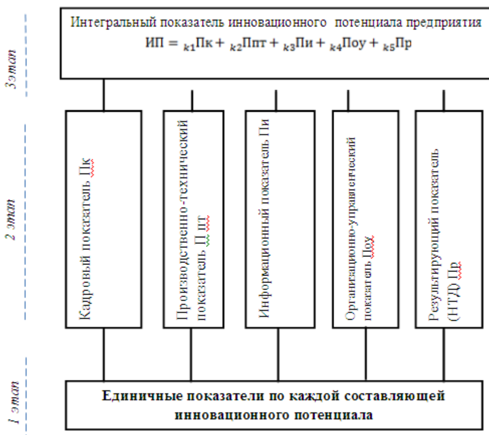
Рис. 3. Структура инновационного потенциала предприятия

где k_i – весовые коэффициенты, определяемые экспертным путем.