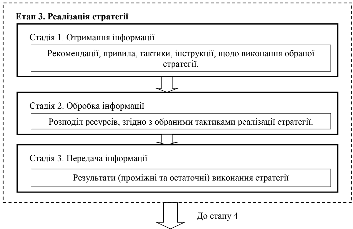
Рис. 3. Схема руху інформації у процесі стратегічного управління (етап 3)