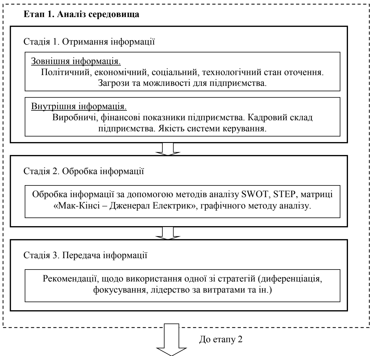
Рис. 1. Схема руху інформації у процесі стратегічного управління (етап 1)

Згідно з цими стадіями можна розробити схему процесу стратегічного управління з доданням інформації, яка використовується у цьому процесі, та напрямків її руху ( рис.1 – рис.4).