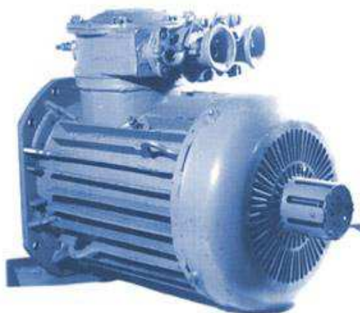
Рисунок 2 — Зовнішній вигляд запровадженого електродвигуна (ЗЕДКОФ250)

Запровадження двигунів було запропоновано на скребкових та стрічкових конвеєрах, на яких функціонують застарілі двигуни. Економічний ефект від запропонованого заходу становить 381,553 тис. грн./рік.