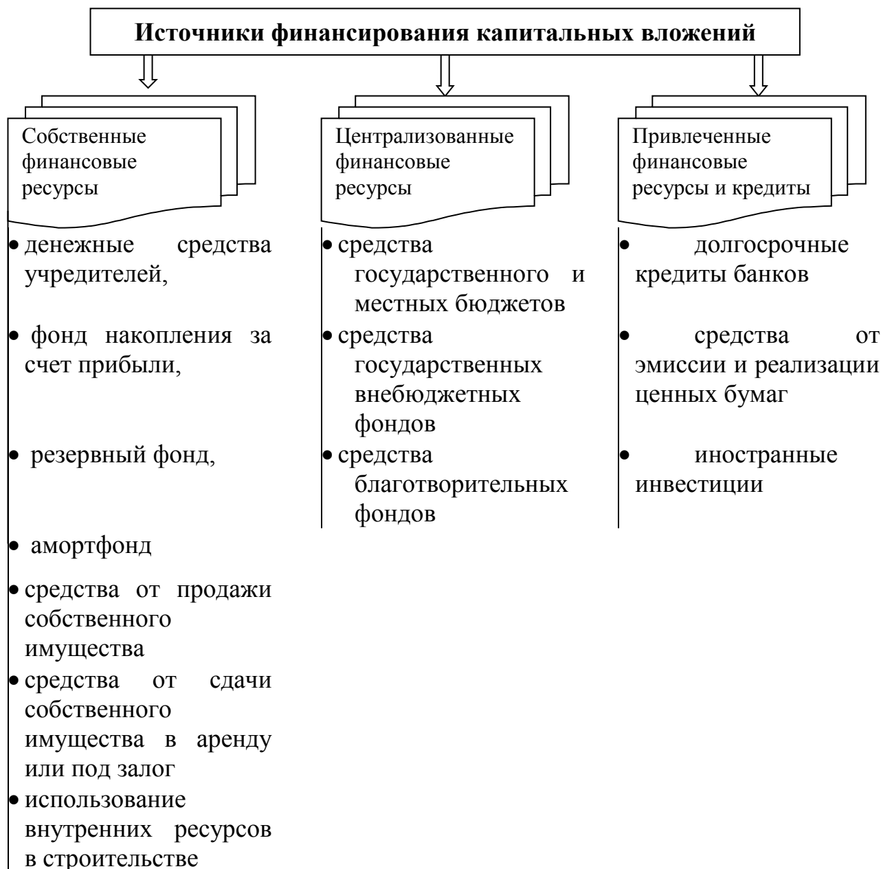
Рис. 4. – Источники финансирования капвложений

Эти источники можно представить следующей схемой (рис. 4):