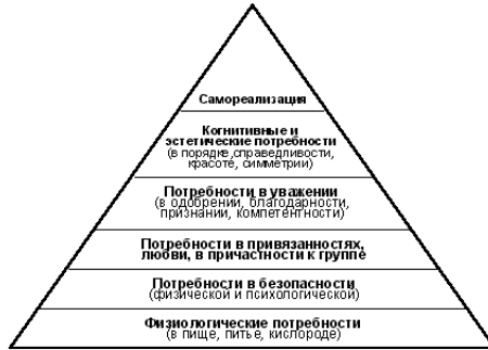
Рисунок 2.1. - Піраміда потреб людини за А. Маслоу

Суспільний прогрес яскраво проявляється в дії закону «возвищення потреб». Цей закон виражає об'єктивну необхідність росту та вдосконалення людських потреб по мірі розвитку виробництва і культури [1, с.16-17].