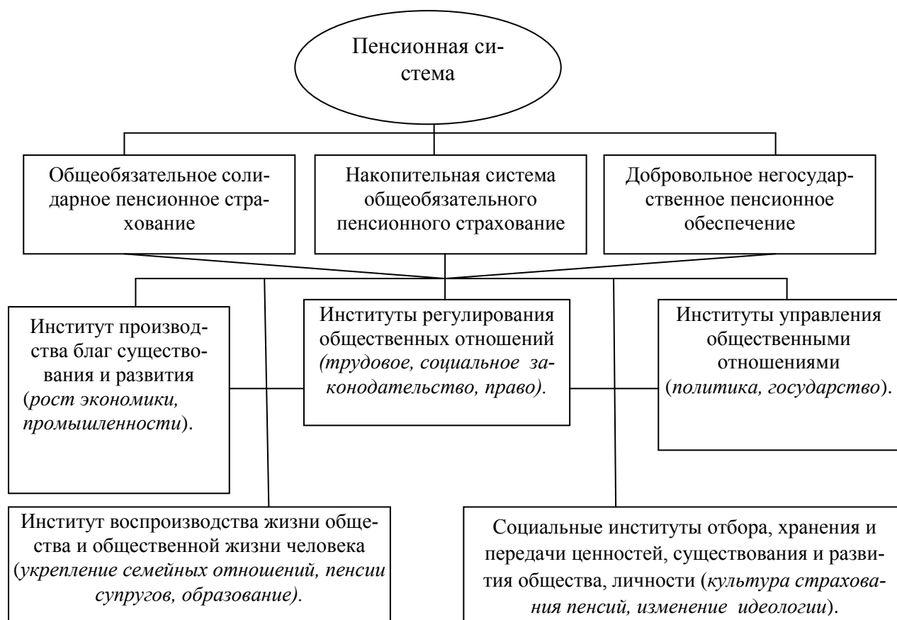
Рис. 1. Влияние пенсионной реформы на основные институты пенсионной системы (институциональный аспект)

В социальном аспекте институты пенсионной системы обеспечивают защиту от бедности, восполнение утраченных доходов, помощи престарелым и инвалидам. При этом предполагается перераспределение общественный продукта как во временных рамках (вертикальная солидарность), так и между категориями населения (горизонтальная солидарность). Перераспределения общественного продукта в национальных системах связаны с моделью экономической политики в стране (либеральная, консервативная, социалистическая и их комбинации), особенностями проводимой социальной политики, историческими и культурными традициями