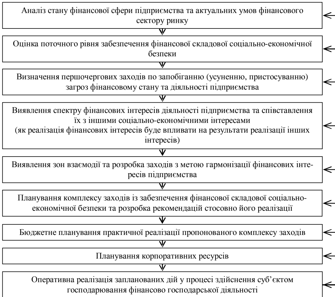
Рис. 2. Етапи забезпечення фінансової складової соціально-економічної безпеки підприємства

контролювати своєчасне та в повному обсязі надходження вхідних матеріальних ресурсів, формувати страхові та технологічні резерви, тим самим створюючи умови забезпечення ритмічності виробничої діяльності.