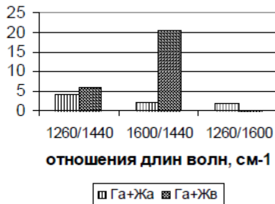
Рис. 2 - Относительная интенсивность полос поглощения НО шихт

Из табл. 1 видно, что шихта \Gamma_a+J_b характеризуется минимальным относительным содержанием -О-, -В- групп ( 11260/2920 , 11260/1440 , 11260/1600 ) и CH_{ар} групп ( 13040/2920 ). Очевидно, уголь J_b , обогащенный алифатическим водородом, способствует увеличению выхода ЖНП. Данная гипотеза подтверждается увеличением интенсивности полос валентных и деформационных колебаний CH_3 -, CH_2 - и CH - групп ( 2920\text{cm}^{-1} , 1440\text{cm}^{-1} ), а также уменьшением относительной интенсивности полос 13040/12920 и 11600/11440 .