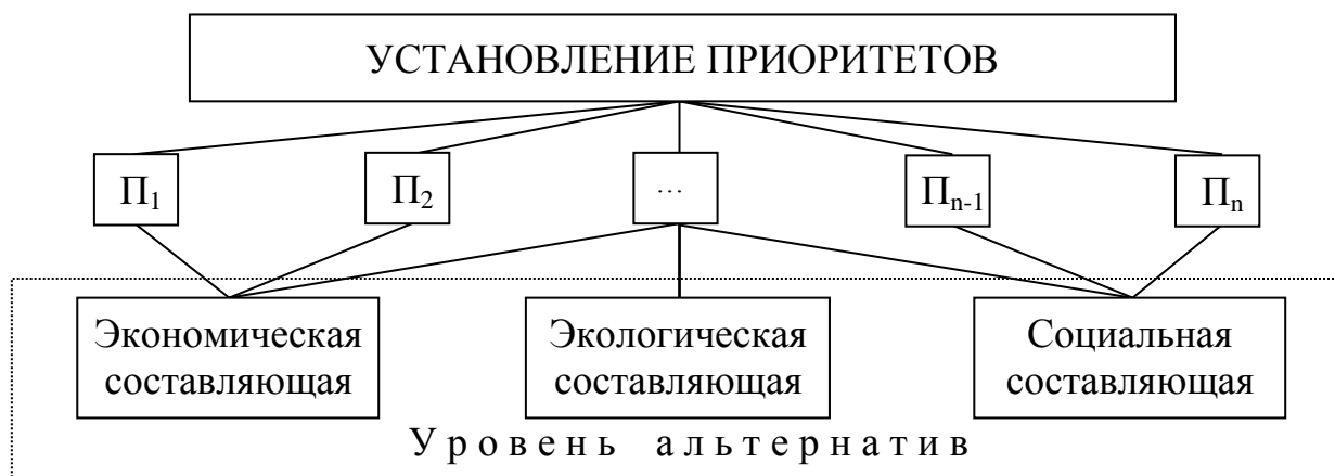
Рис. 3. Трехуровневая иерархическая структура установления приоритетов.

анализа иерархий доказана как теоретически, так и практически при решении многокритериальных задач оценки в различных сферах экономики [6]. Метод анализа иерархий является достаточно сложным и трудоемким, поэтому некоторые ученые посвятили свои труды упрощению метода [4, 5, 8]. Для установления приоритетов отдельных составляющих целесообразно использовать адаптированный вариант метод анализа иерархий, графическая интерпретация которого приведена на рис. 3.