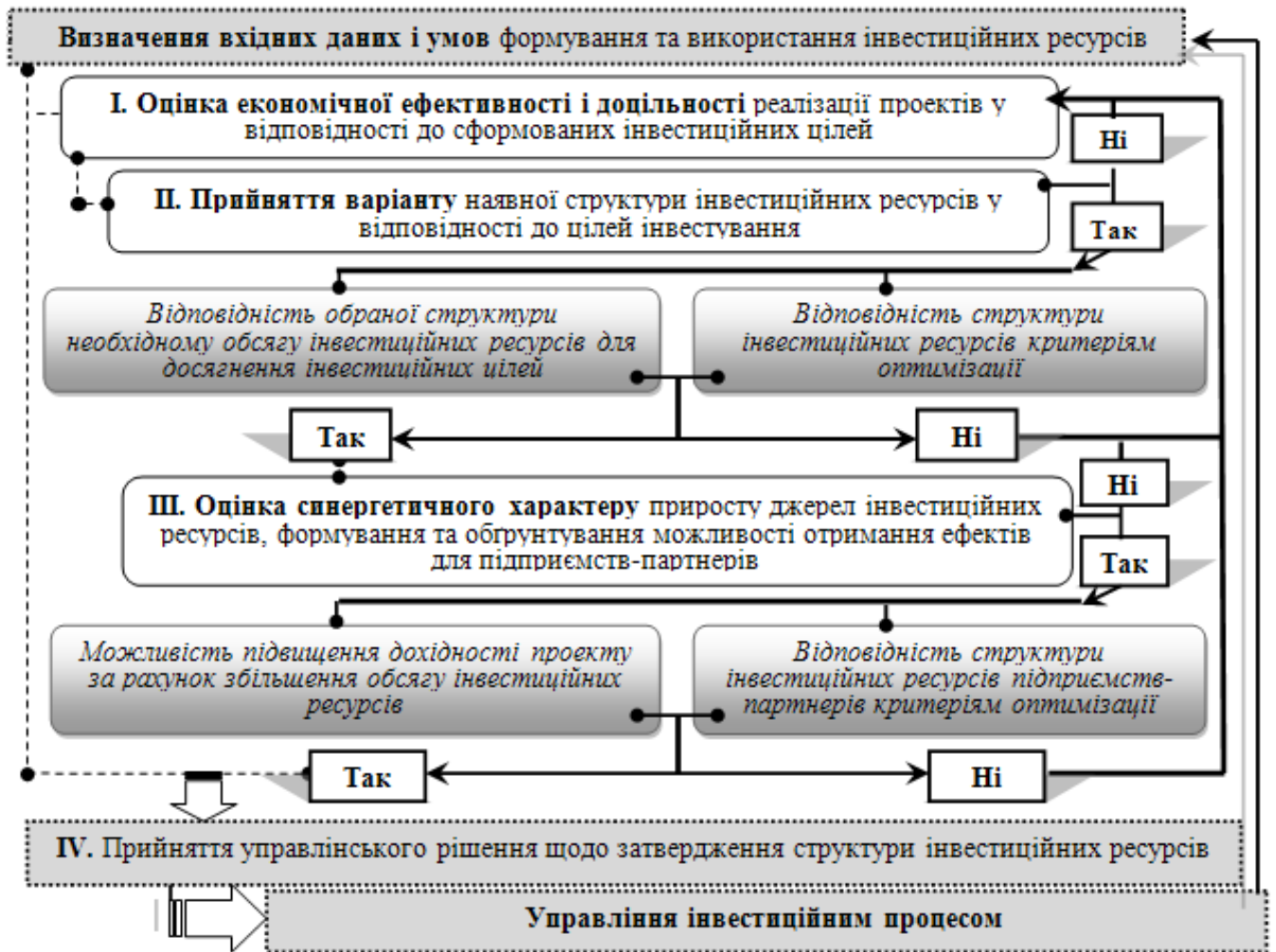
Рис. 4 Схема оптимізації інвестиційних ресурсів на підприємствах малого та середнього бізнесу

Оцінка структури капіталу малих та середніх підприємств та їх приросту за рахунок наявних інвестиційних ресурсів свідчить, що переважна більшість вкладених інвестиційних ресурсів є короткостроковими, які формуються за рахунок залучених і позикових джерел. Встановлено, що в залежності від нормативів розрахунково-платіжної дисципліни у 2012 р. 85% приросту інвестиційних ресурсів малих та 73% приросту інвестиційних ресурсів середніх підприємств концентрувалися в оборотних активах шляхом збільшення запасів та дебіторської заборгованості. Таке використання наявних інвестиційних ресурсів не сприяє розвитку матеріальної бази підприємств, оновленню або розширенню їх основних засобів.