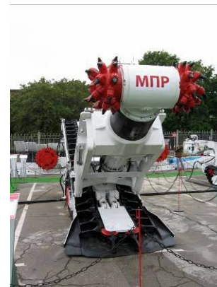
Рис. 10 – Піддирально-навантажувальна машина МПР

Привертала увагу незвичним виглядом піддирально-навантажувальна машина МПР (рис. 10), виробництва ЗАТ «Горлівський машинобудівник», призначена для механізації процесів піддирання підшви і навантаження гірської маси при відновленні перетину гірничих виробок з максимальною міцністю порід до 5 у виробках з кутом до \pm 12^\circ . Може використовуватись для проведення нарізних виробок. Виконавчий орган машин МПР має можливість розвороту відносно поздовжньої осі на 180^\circ для підвищення ефективного підривання та навантаження породи. Кільцевий скребковий конвеєр має реверсивний режим і разом з поворотною і підйомною секціями забезпечує можливість заднього і бокового розвантаження породи в будь-які транспортні засоби.