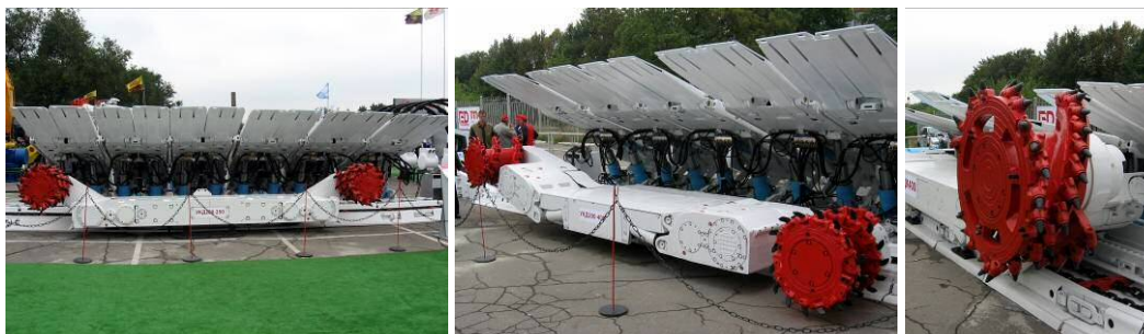
Рис. 6 – Очисні комбайни ЗАТ «Горлівський машинобудівник»: УКД 200-250, УКД 200-400, КДК 400

енергозавод», а також ВАТ «Каменський машзавод» (Росія) – представило очисні комбайни для тонких та середньої товщини пластів (рис. 6), механізовані кріплення 09ДТ, ДМ, КД90.