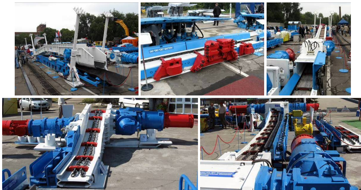
Рис. 4 – Продукція ХМЗ «Світло Шахтаря» (зліва направо): перевантажувач СП 251.16, стругова установка комбінованого типу УСК30, шахтна малогабаритна дробарка ДШМ1, привід винесеної системи подавання комбайну ВСПК, скребковий забійний конвеєр серії СПЦ 230 с боковим розвантаженням

Найбільшу цікавість відвідувачів викликали, звичайно, зразки діючої техніки, представлені на відкритій площадці експозиції. Традиційно широко представлена продукція ХМЗ «Світло Шахтаря», яка присутня, мабуть, на всіх шахтах України: скребкові конвеєри, перевантажувачі, струги та ін. (рис. 4).