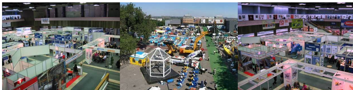
Рис. 3 – Павільйони та відкрита площадка виставки

У 2010 році участь у виставці «Уголь/Майнинг» прийняли 494 компанії з 16 країн – України, Росії, Казахстану, Білорусі, Німеччини, Польщі, Чехії, Великобританії, США, Турції, Словаччини, ПАР, Ізраїлю, Китаю, Норвегії, Данії – які на загальній площі 19310 м 2 продемонстрували свою продукцію, сучасні технології і промислові зразки, багато з яких були діючими. Виставка проходила у двох павільйонах і на відкритій площадці (рис. 3). За чотири дні виставку відвідали 18160 фахівців.