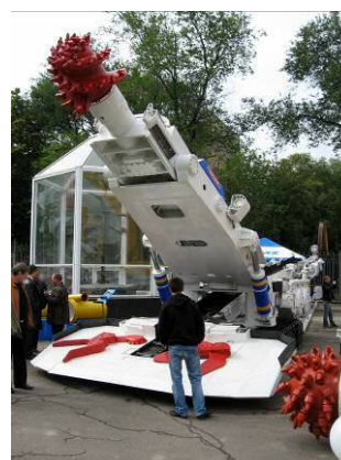
Рис. 7 – Прохідницький комбайн П110-04