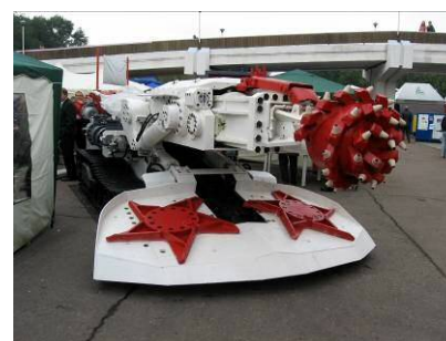
Рис. 8 – Прохідницький комбайн КП-75Д