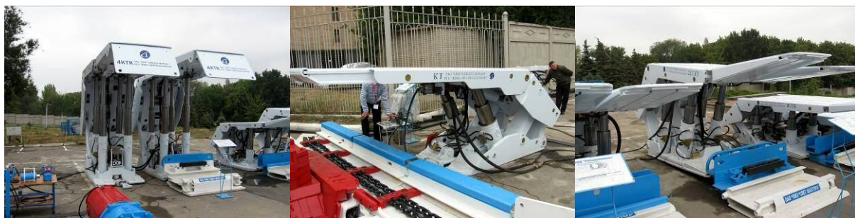
Рис. 5 – Механізовані кріплення ЗАТ НВП «Спецвуглемаш» (зліва направо): 4КТКУ, КТ, 2КТКУ (на задньому плані 1КТК)

ЗАТ НВП «Спецвуглемаш» сумісно з ВАТ «Горлівський машинобудівельний завод «Універсал»» вперше представило «наживо» механізовані кріплення власної розробки для комбайнових лав – 1КТК, 2КТК, 2КТКУ, 3КТК, 4 КТК і КТ – для стругових лав (рис. 5). Серія КТ розроблена для виймання пластів товщиною від 0,85 до 3,2 м з важкими покрівлями, що забезпечується підсиленою конструкцією кріплення з питомим опором не менше 850 кН/м 2 .