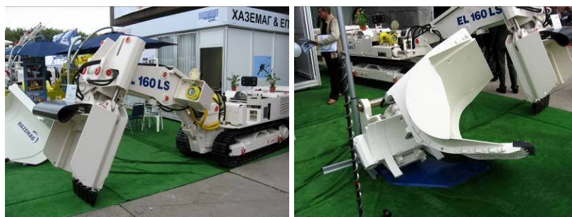
Рис. 11 – Підшвопіддиральна машина Hazemag EL 160 LS з активним ковшем. Праворуч – змінний ківш із боковим розвантаженням

Компанія «Hazemag & EPR» продемонструвала підшвопіддиральну машину EL 160 (рис. 11). Базова модель може комплектуватись відповідно із доволі широким переліком застосувань, шляхом заміни активної частини. В якості навісного обладнання може застосовуватись: активний ківш або ківш із боковим розвантаженням, гідроударники, напрямні балки автоподатчика. Представлена на експозиції модифікація EL 160 LS, крім того, може обладнуватись напрямними балками анкеростановника і бурильної установки. Заміну обладнання можна здійснювати безпосередньо на робочому місці завдяки пристрою для швидкої заміни.