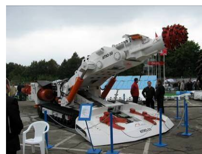
Рис. 9 – Прохідницький комбайн КПЮ-50