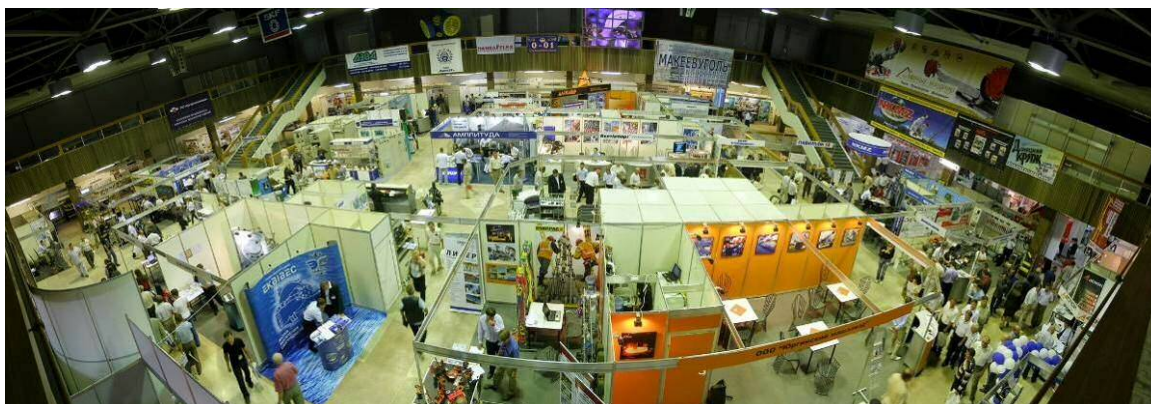
Рис. 1 – Вигляд одного з павільйонів виставки

Участь у виставці приймають провідні компанії України, країн СНД і дальнього зарубіжжя, що розробляють, виробляють, постачають сучасне обладнання, інструмент, матеріали для гірничодобувного і переробного комплексу, надають послуги в сфері фінансування, страхування, впровадження передових технологій в галузі.