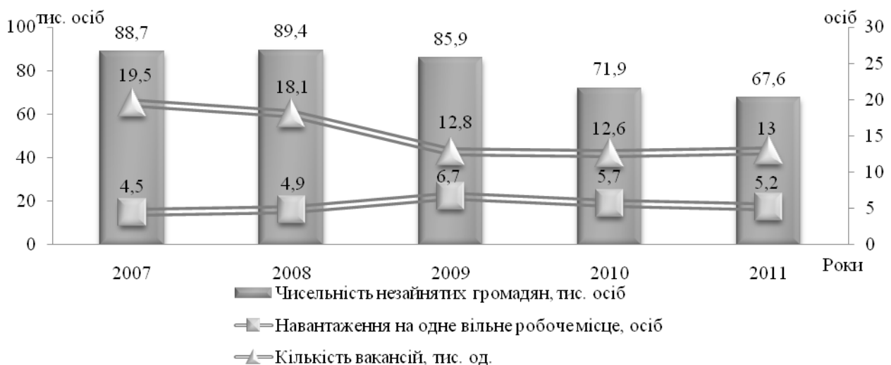
Рисунок 3 – Попит та пропозиція на зареєстрованому ринку праці Донецького регіону за 2007-2011 рр.

У 2011 р. кількість зареєстрованої безробітної молоді складала 67,6 тис. осіб, а загальна кількість вакансій по Донецькому регіону – 13,0 тис. од. Таким чином, на одне вакантне місце претендувало 6 осіб. Дані представлені на рис. 3.