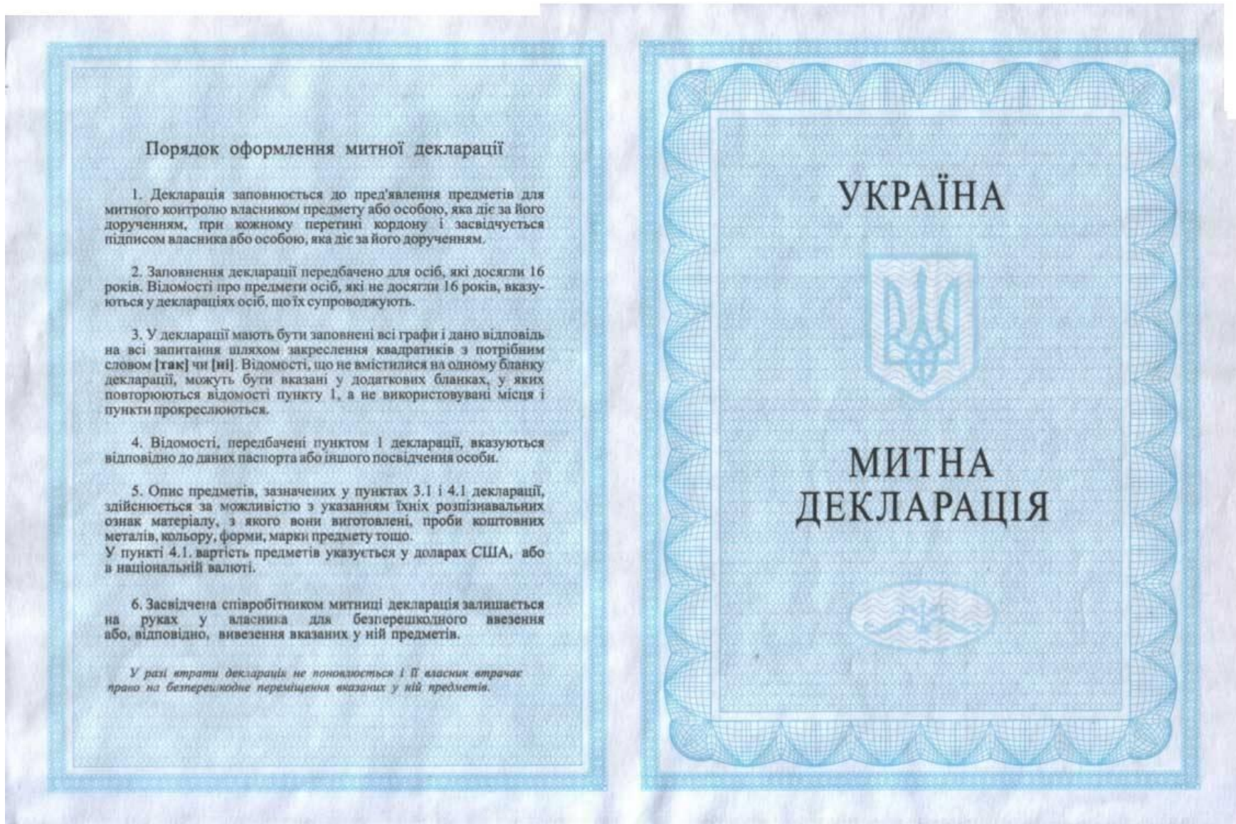
Рисунок Е.1 – Митна декларація