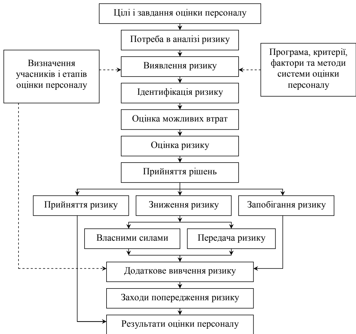
Рис. 2 – Послідовність аналізу ризику при оцінці персоналу

Ризики, що виявленні на кожному етапі оцінки персоналу, доцільно згрупувати за видами. В науковій літературі існує багато критеріїв для класифікації ризиків [7; 8; 10]. На підставі узагальнення існуючих наукових підходів та у зв'язку з необхідністю врахування особливостей оцінки персоналу розроблено спеціальну класифікацію ризиків під час оцінки персоналу та надано визначення ризиків за видами, табл. 1.