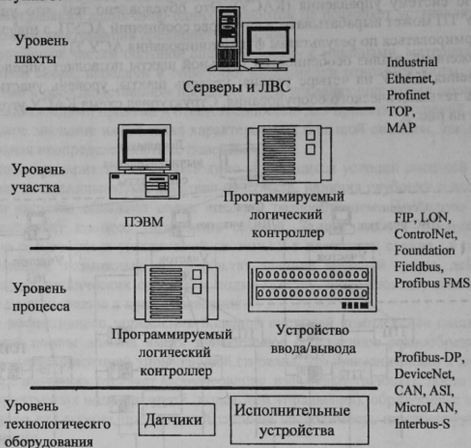
Рисунок 3 - Области применения телекоммуникационных технологий

подхода. Классический подход к автоматизации сложных распределенных объектов предусматривает подключение каждого датчика к центральному контроллеру отдельным (и довольно дорогим) высококачественным кабелем. Это же относится и к подключению исполнительных органов. Альтернативой описанному подходу, являются системы автоматического управления, построенные с использованием промышленных шин - fieldbus. К наиболее известным и применяемым в мире открытым промышленным сетям относятся: CAN, LON, Profibus, Interbus-S, FIP, ControlNet, Foundation Fieldbus, DeviceNET, ASI, HART, MicroLAN, и некоторые другие [3, 5]. Каждая из перечисленных систем имеет свои особенности, достоинства и предназначена для применения на определенном уровне предприятия, что изображено на рисунке 3.