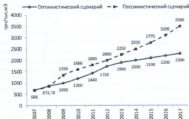
Рис. 1 – Динамика цен на природный газ

Изложение основного материала. Определяющим показателем конкурентоспособности экономики любого государства является показатель энергоёмкости ВВП. Значимость данного показателя для экономики Украины возрастает на порядок в условиях «газовых войн» с Россией. Таким образом, снижение зависимости национальной экономики от импортируемого природного газа является важнейшей задачей, которая во многом определит будущее развитие нашего государства. Ситуация усугубляется еще и тем, что наблюдается стабильное повышение цен на энергоносители. Так, согласно прогнозным расчетам Мирового банка, цены на природный газ в Украине до 2017 года повысятся до 2 300-3 500 грн/тыс. м 3 , или в 3,4-5,1 раза в сравнении с текущей ценой, заложенной в действующих тарифах, в зависимости от реализации оптимистичного или пессимистического сценария (рис. 1).