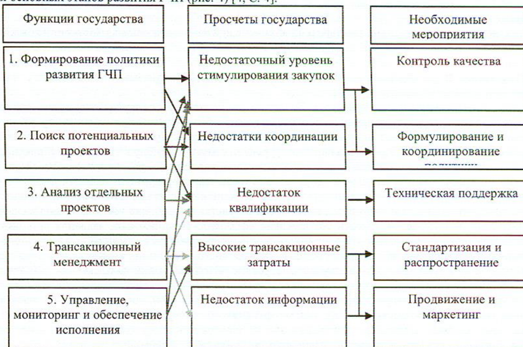
Рис. 4 – Этапы развертывания ГЧП в рамках ЦРГЧП

Именно в рамках ЦРГЧП разрабатываются и внедряются меры, которые направлены на ликвидацию институциональных провалов. При этом отправной точкой в деятельности ЦРГЧП должна стать эффективная организация основных этапов развития ГЧП (рис. 4) [4, С. 4].