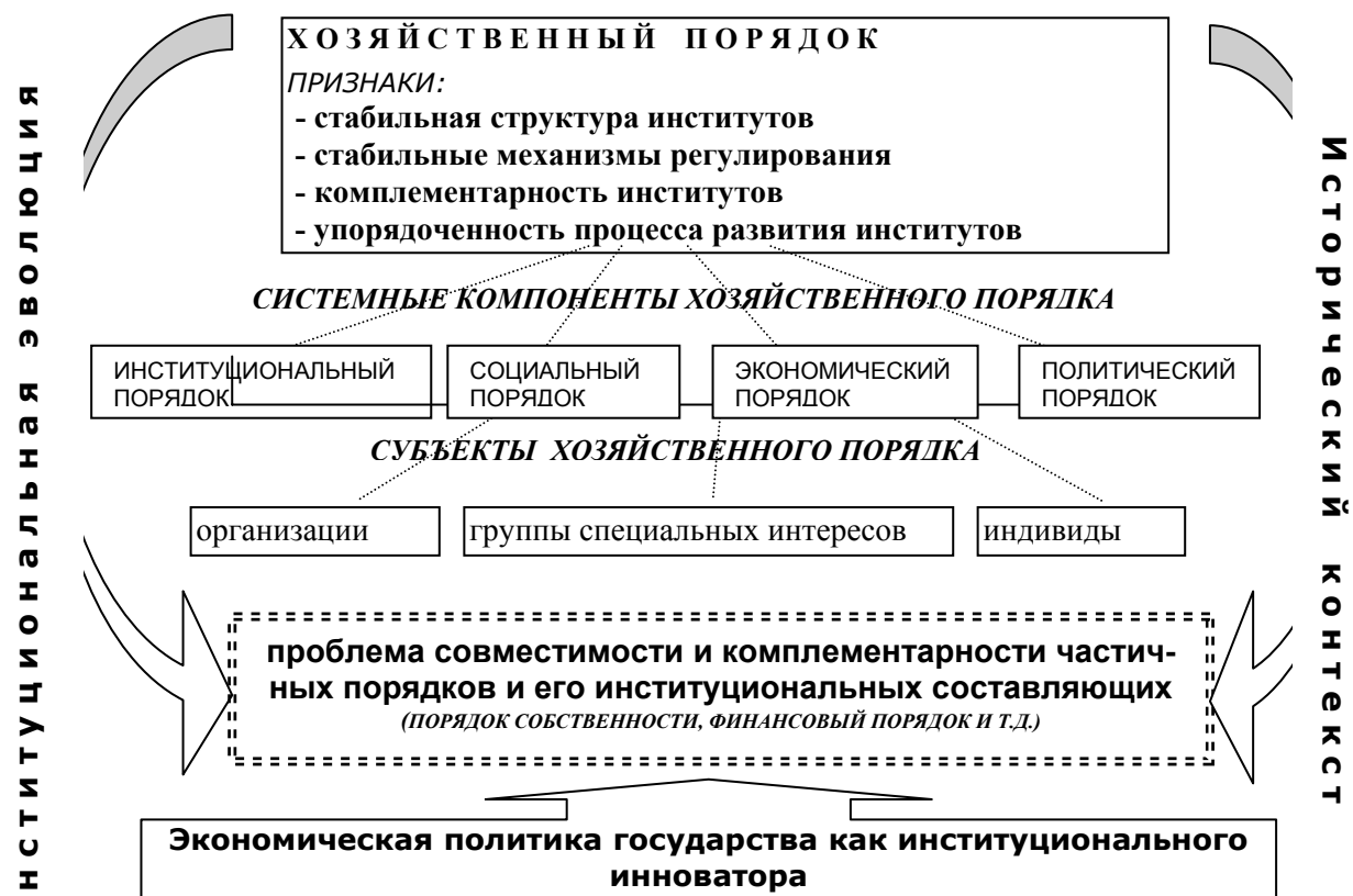
Рис.2. Составляющие хозяйственного порядка в институциональном контексте 31

Формирование хозяйственного порядка также осуществляется при участии государства. Именно государство выступает организующим элементом институциональной структуры (institutional arrangement) или, по Уильямсону, институциональной среды (institutional environment). Но действия государства во многом зависят от доминирующих во властных структурах групп специальных интересов. Следовательно, государство является основным институциональным инноватором, который создает и поддерживает институциональную структуру того или иного хозяйственного порядка (рис. 2).